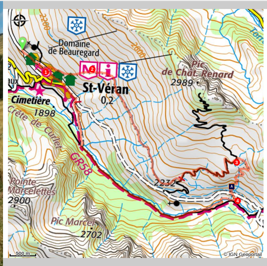
Arrivée sur Saint Véran (Benjamin Musella - PNR Queyras)

Dalla preistoria ai giorni nostri questo percorso ci propone un viaggio nel tempo tracciando la relazione tra l'uomo e la montagna.