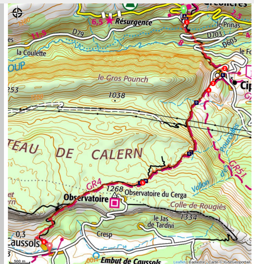
Paysage donnant sur Caussols