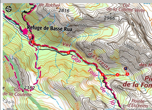
Val d'Escreins

Il y a 16 000 ans, un glacier a modelé ce val sauvage et lumineux.