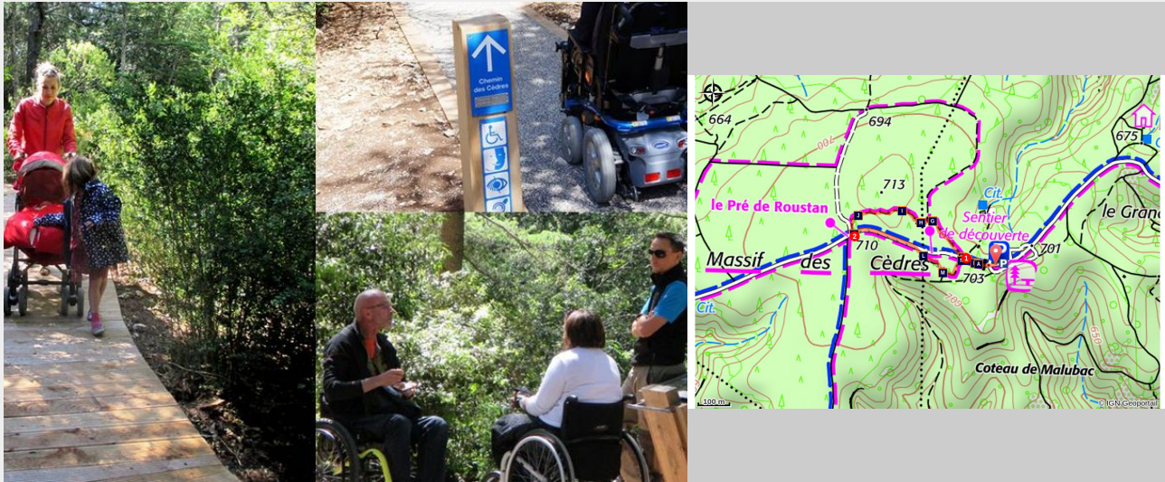
Chemin des cèdres, accessible à tous...