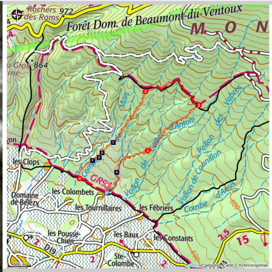
Combe de Curnier

Randonnée sauvage dans la Combe de Curnier, au pied du Mont Ventoux, entre falaises et nature préservée.