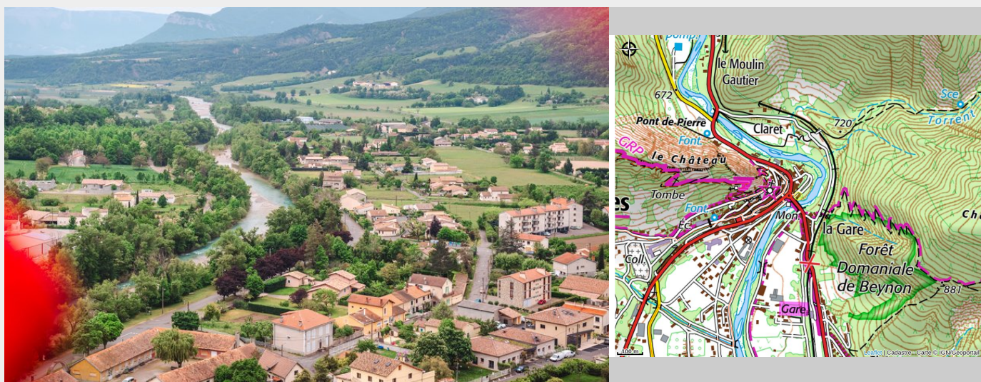
Tour des Baronnies provençales à pied_Serres

Une semaine en itinérance au cœur du massif des Baronnies provençales, pourquoi pas ? Parcourez les paysages sauvages et singuliers des espaces naturels classés et dégustez des produits du terroir. Un séjour qui ravira papilles et pupilles !