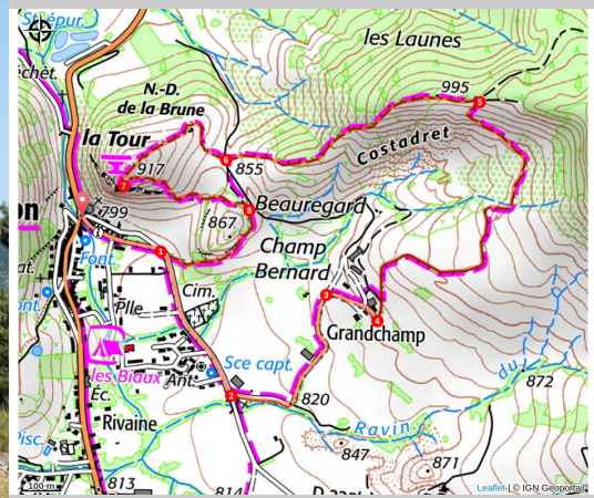
Sur la crête de Costadret (Vincent AUBERT - PNR Baronnies provençales)

Une petite boucle proche de Séderon vous immergeant dans un panorama façonné par le pastoralisme et l'agriculture traditionnelle.