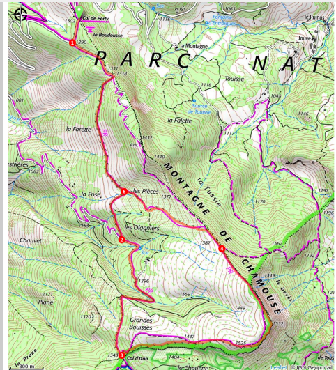
La montagne de Chamouse, Montauban-sur-l'Ouvèze

Cette boucle parcourt une mosaïque de milieux : lande, forêt et alpage, avec pour toile de fond un panorama du Mont Ventoux aux Ecrins.