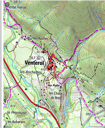
Vue d'ensemble de Venterol

Une virée dans un village tout droit sorti d'une crèche de santons provençale. A l'ombre des oliviers face au campanile dominant le bourg, vous tomberez rapidement sous son charme !